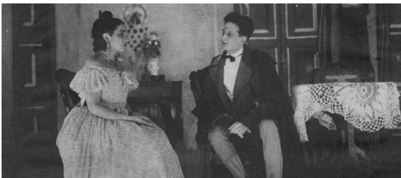
La actriz Margarita Xirgu como Mariana Pineda