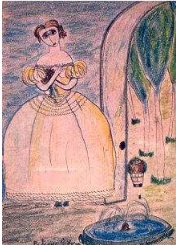
Federico García Lorca dibujo de Mariana Pineda