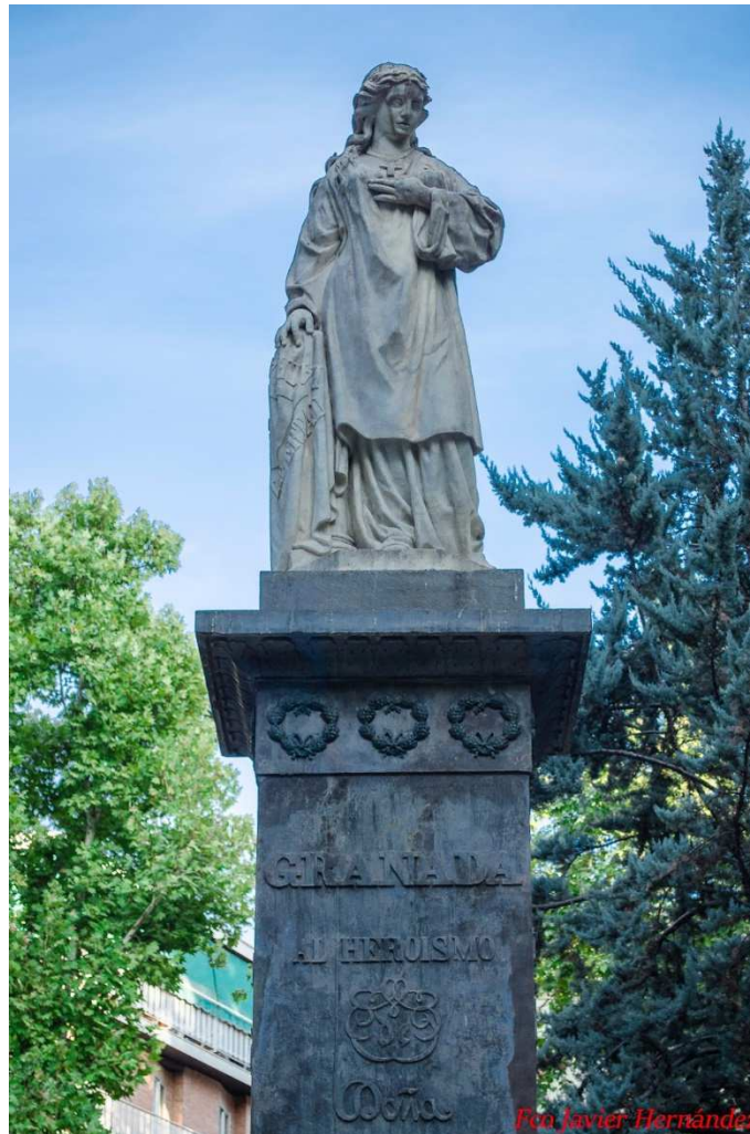
Monumento a Mariana Pineda, Granada

cómputo silábico, ritmos, agrupaciones,...Es importante adquirir conocimientos sobre Historia de la Literatura, Historia de España y Universal: relacionar y comparar sucesos históricos de diferentes países,...en definitiva aprender a relacionar las múltiples materias que son objeto de estudio en cada curso o etapa, saber las relaciones internacionales y globales, no solo actuales, sino del pasado en distintos países, es importante para la adquisición de conocimientos y valores de nuestros alumnos.