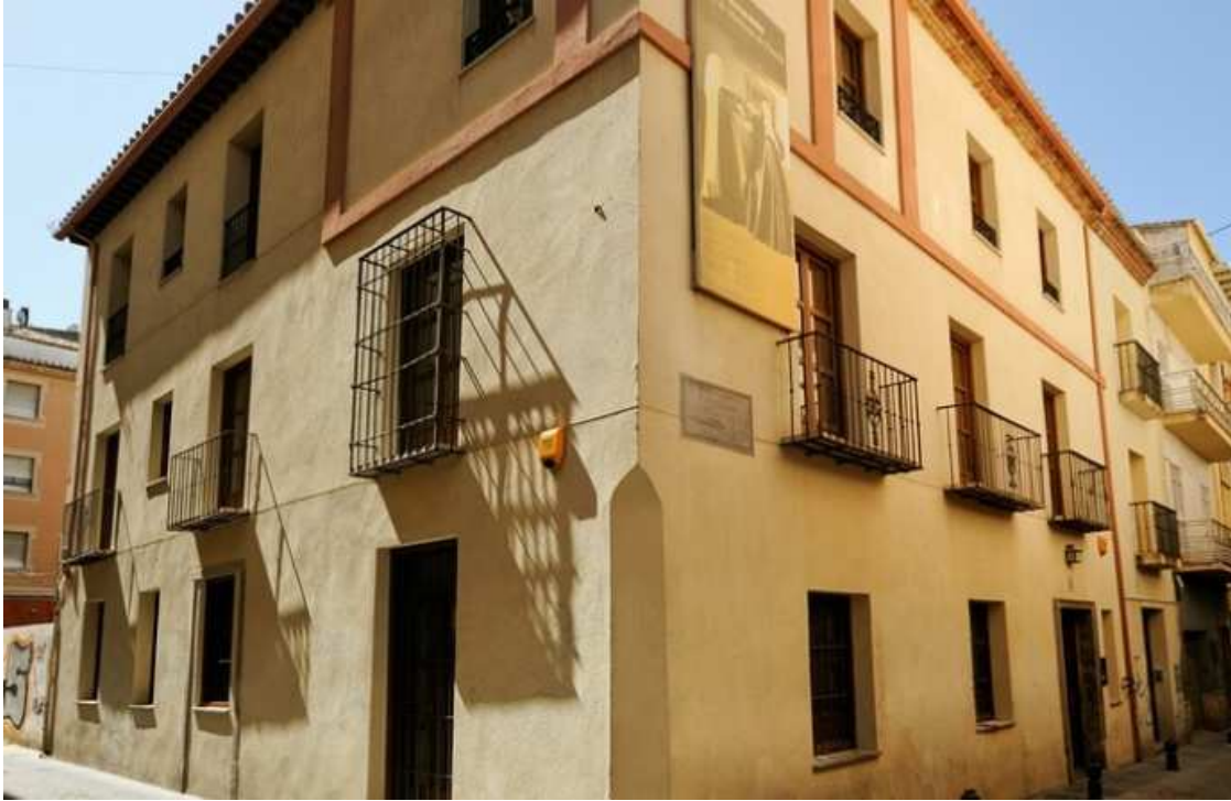
Casa de Mariana Pineda- Granada

Como ya adelantábamos la adecuación de estas actividades a las diferentes edades, materias y cursos, debe hacerse de una forma flexible y con una metodología muy participativa, dando protagonismo siempre a las iniciativas y creatividad de los alumnos, tanto a la hora de utilizar los recursos disponibles como en la realización de las propias actividades: