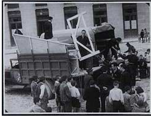
Compañía Universitaria de teatro La Barraca

Hay un acontecimiento que satisfizo particularmente la inquietud intelectual de Lorca: La Barraca: compañía universitaria de teatro que llevaba representaciones y lecturas al mundo rural: no pudo dedicarla mucho tiempo porque percibió aires de guerra y volvió a Granada para estar con su familia, al producirse el golpe de estado se refugia en casa de Luis Rosales, falangista y amigo: unos autores no tienen duda de que le delató y otros de que fueron los hermanos de éste y Luis intentó protegerle. En cualquier caso un 18 de agosto, solo un mes más tarde del levantamiento militar, en 1936...: el final es por todos conocido.